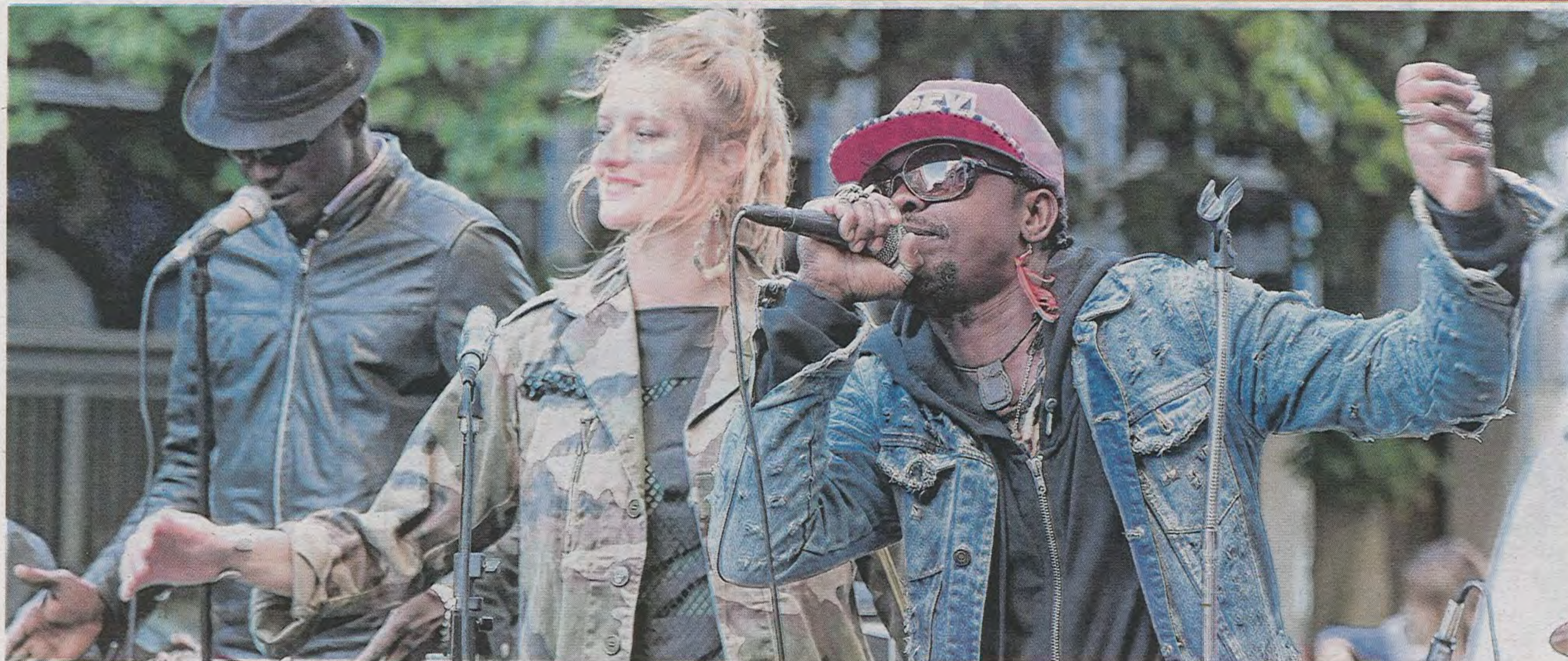
Chaque 21 juin, c'est l'occasion pour les musiciens de partager leur passion avec les spectateurs d'un soir.